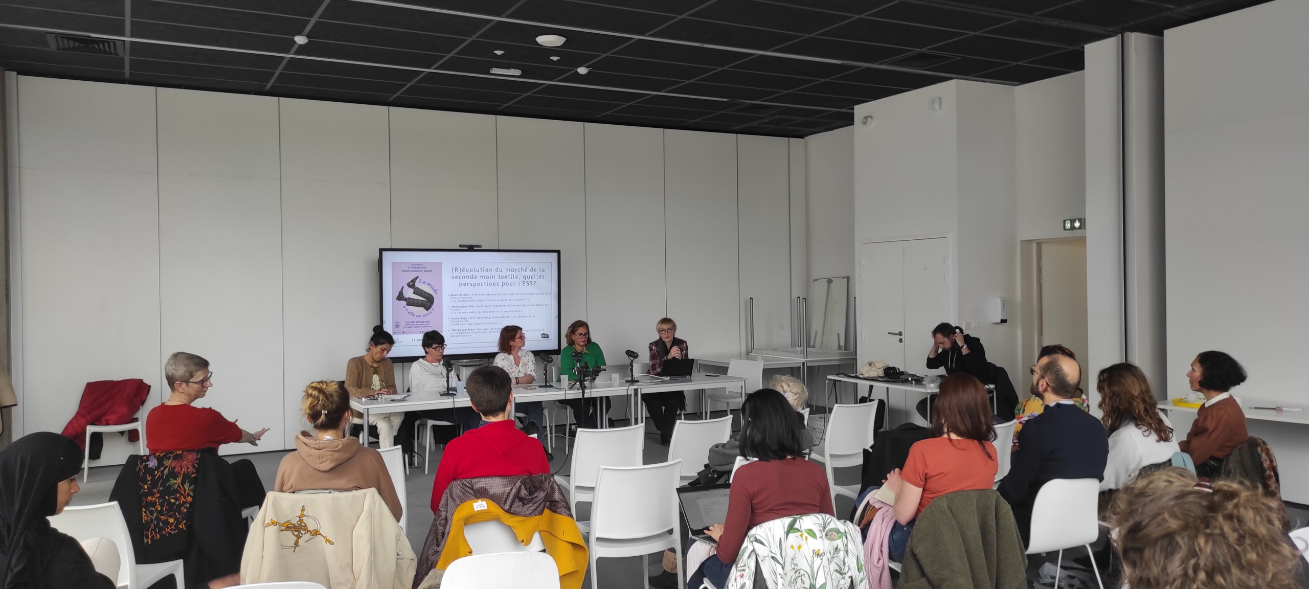
Ecoute sonore : Le marché de la seconde main en pleine (r)évolution